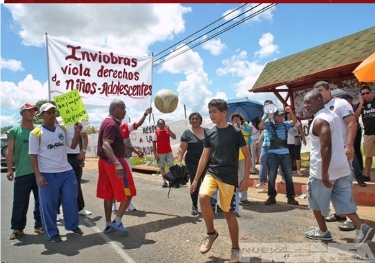
Vecinos de la comunidad aseguran que los niños son los más perjudicados