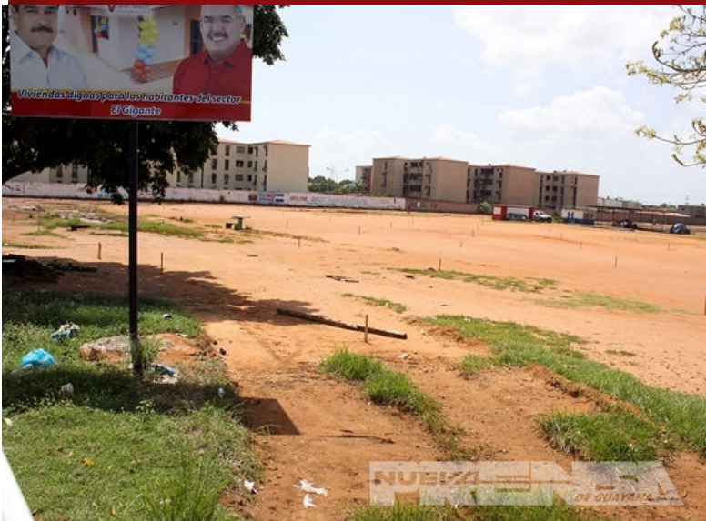
El terreno ya está siendo trabajado por el proyecto de la GMVV

Claudia Martínez